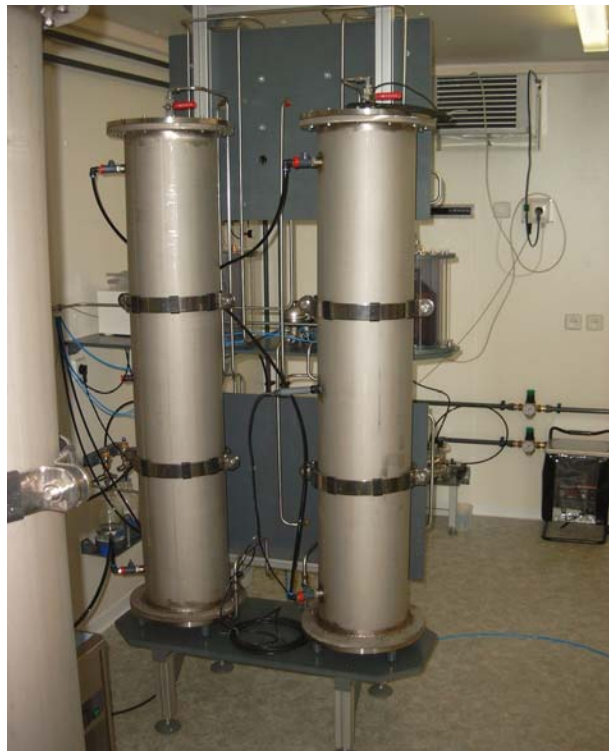
Innenansicht der Pilotanlage