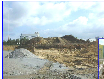
Aushubmassen und Baugrubenplanum