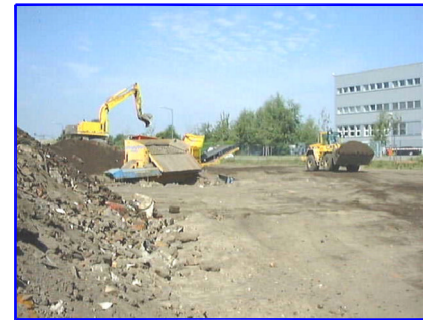
Separierung der Massen